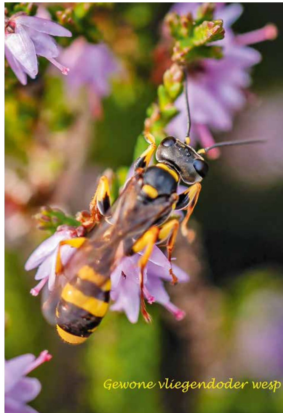
Gewone vliëgendoder wesp